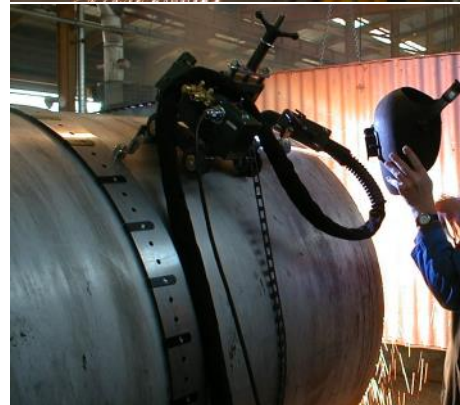
Rail de guidage en option et porte-chalumeau personnalisé