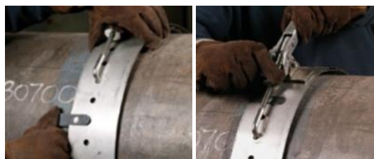
Systemes de rail de guidage à fixation rapide